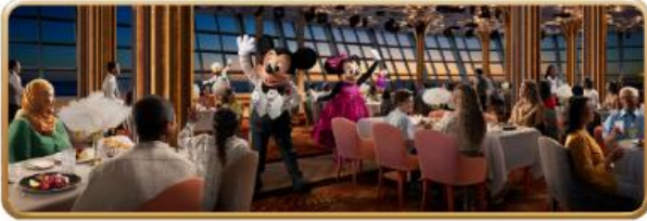
Hollywood Spotlight Club