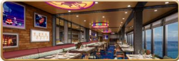
Pixar Market Restaurant