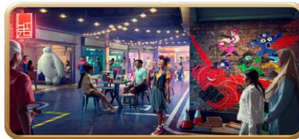
San Fransokyo Street