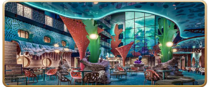
Disney Discovery Reef