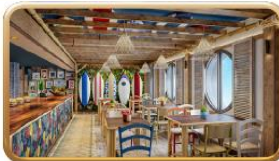
Stitch's 'Ohana Grill