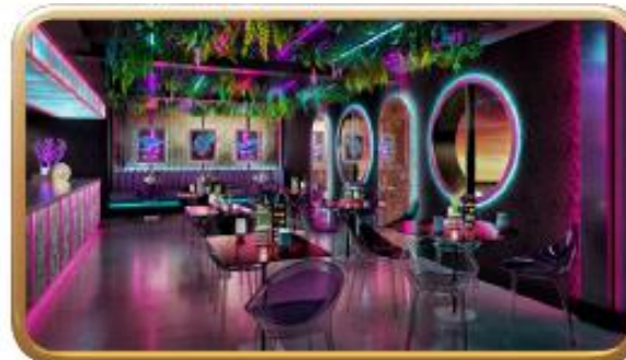
Bewitching Boba & Brews

為遵守『商品說明條例』，本公司已即將所有旅遊產品內需要額外支付之膳食及額外之入場費用『清清楚楚』列明於單張內，以保障消費者權益，這是EGL公司之文化！！