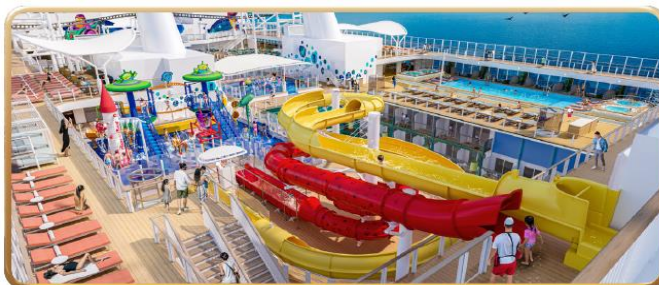
Toy Story Place