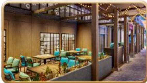
Mike & Sulley's