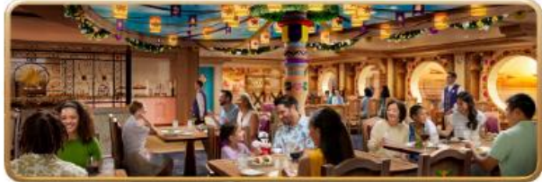
Enchanted Summer Restaurant